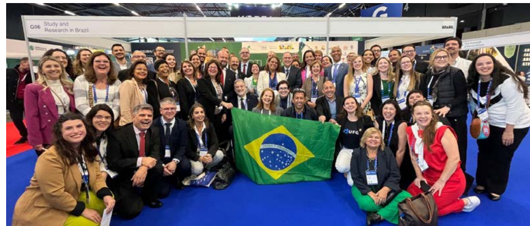
42 IES Associadas em estande financiado pela SESu-MEC e IGR-MRE

EAIE: European Association for International Education Roterdã, Países Baixos, 26-29/09/2023