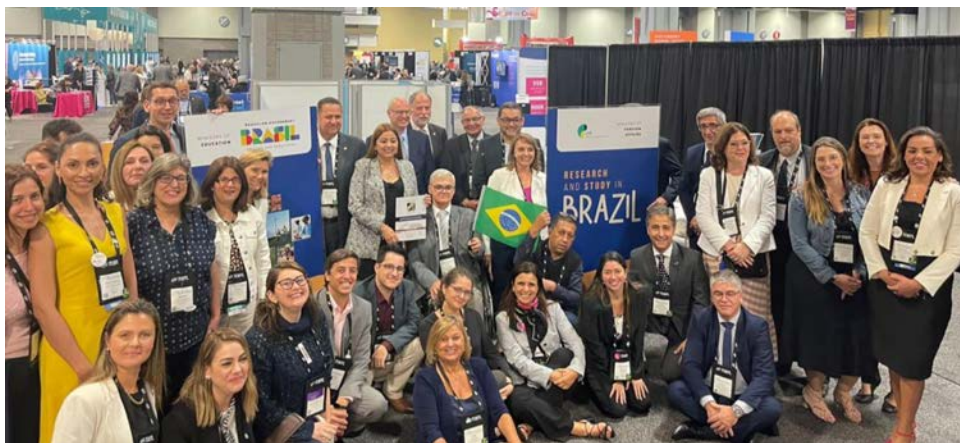
30 IES Associadas em estande financiado pela SESu-MEC e IGR-MRE

NAFSA: Association of International Educators Washington, EUA, 30/05-02/06/2023