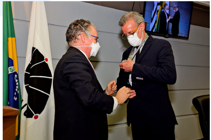
A entrega da insígnia da Unicamp marca a transferência simbólica do cargo de Reitor da Unicamp

A cerimônia terminou com uma apresentação especial virtual do Coral Zíper na Boca, composto por alunos, professores e funcionários da Unicamp. Após a posse, Tom Zé deve encaminhar ao Conselho Universitário a composição de sua equipe de trabalho para a gestão 2021-2024. A sessão está marcada para o dia 27 de abril.